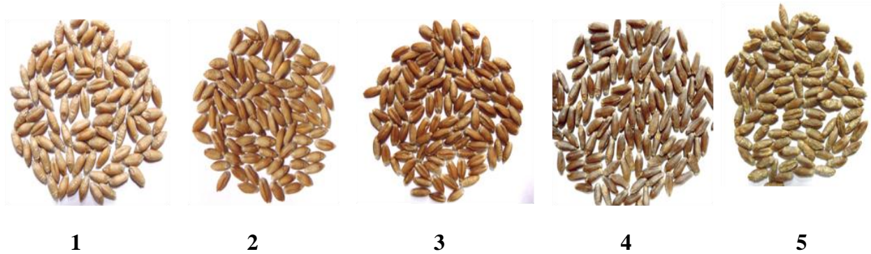
Рис. 2. Різноманіття зразків колекції тритикале ярого за забарвленням зерна: 1 – жовто-біле (УКРО), 2 – світло-коричневе (Легінь харківський), 3 – коричневе (ЯТХ 231-15), 4 – темно-коричневе (Оберіг харківський), 5 – зеленувате (ЯТХ 2099-12)

Колекція включає карликові форми з довгим колосом, великою вегетативною масою, коричневим, білим, янтарним, крупним, видовженим, твердим і м'яким зерном та багатьма іншими цінними господарськими ознаками, які сприяють значному прискоренню селекційного процесу та дозволяють створити комплексно цінні високоврожайні сорти [22] (рис. 2).